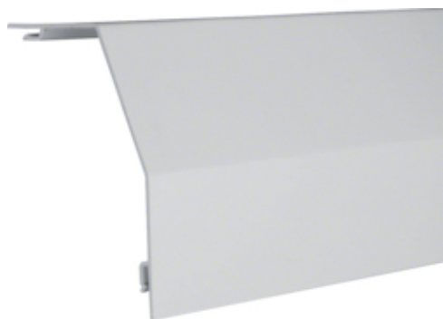
tehalit.RK 150 Pokrywa główna jasnoszary