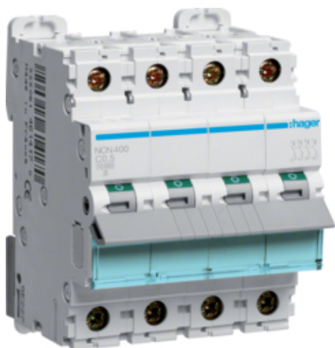
MCB Wyłącznik nadprądowy I_{cn}=10000A / I_{cu}=15kA 4P C 0,5A