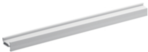
tehalit.LFH Przegroda z PC ABS H40mm