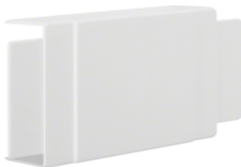
tehalit.LF Element T/X, 40x90mm, biały