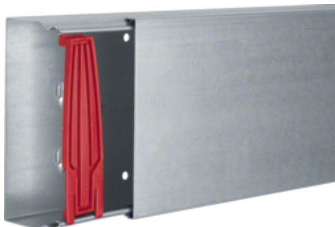
tehalit.LFS Kanał stalowy 60x150mm, ocynk