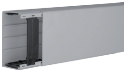
tehalit.LF Kanał elektroinstalacyjny PVC 60x110mm, szary