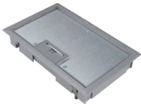
tehalit.VE-EE Pokrywa uchylna płytki montaż E04 147X247 8mm stal szary PA