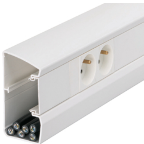
Zdjęcie produktu GBD501000