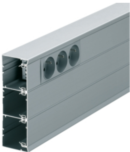
tehalit.GBA Podstawa 50x161mm alu anodyzowany