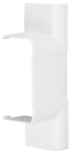
tehalit.BRN Element T 70130 biały