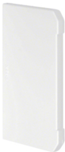
tehalit.BRN Końcówka 70110 biały