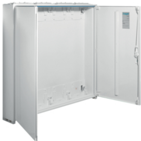
univers Obudowa FW pusta IP44/II 950x1050x160