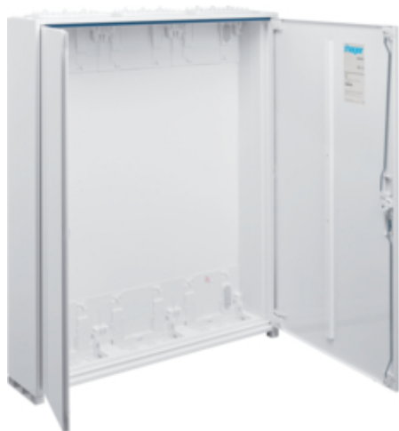
univers Obudowa FW pusta IP44/II 950x800x160