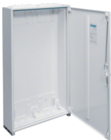
univers Obudowa FW pusta IP44/II 950x550x160