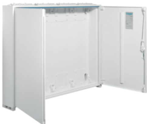
univers Obudowa FW pusta IP44/II 800x1050x160