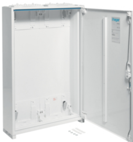
univers Obudowa FW pusta IP44/II 800x550x160