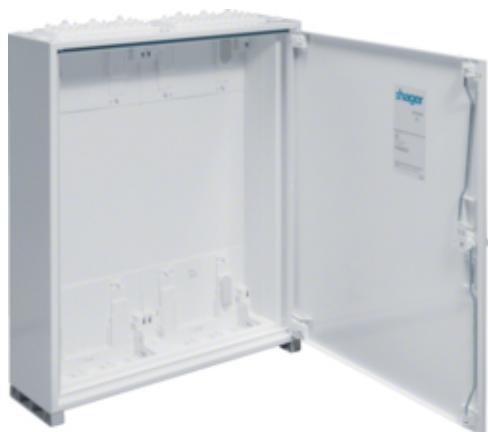
univers Obudowa FW pusta IP44/II 650x550x160