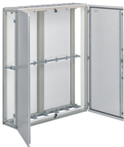
univers Obudowa stojąca IP54 kl.II 1600x1900x400mm RAL7035