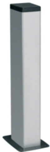
tehalit.DA200 Minikolumna dwustronna DA200-80 H=650mm alu