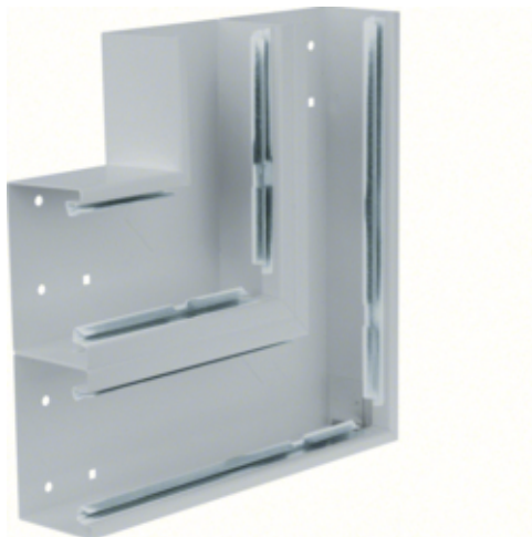
tehalit.BRS Kąt płaski 65x210 D, stalowy, ocynkowany