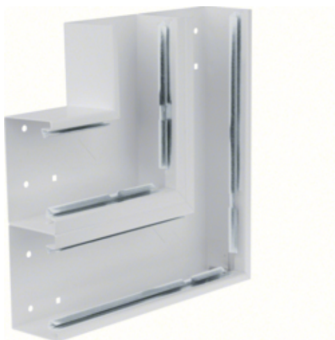
tehalit.BRS Kąt płaski 65x210 D, stalowy, jasnoszary