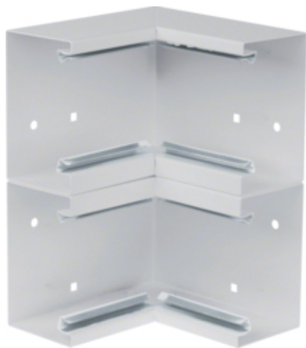
tehalit.BRS Kąt wewnętrzny 65x210 D, stalowy, jasnoszary