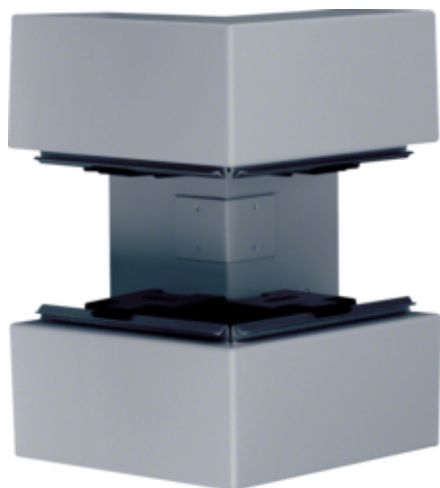
tehalit.BRS Kąt zewnętrzny 65x210, stalowy, ocynkowany