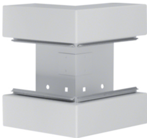
tehalit.BRS Kąt zewnętrzny 65x170, stalowy, jasnoszary