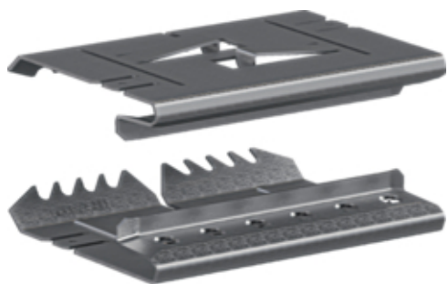
tehalit.BRS Łącznik podstawy 65x100