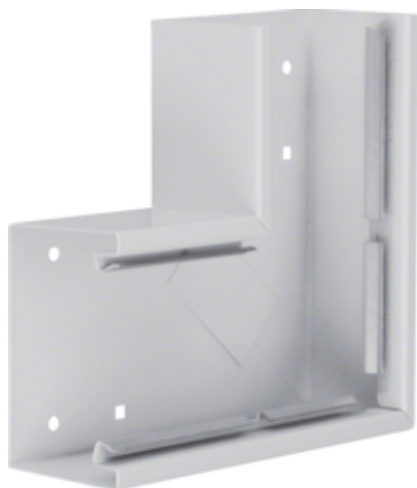
tehalit.BRS Kąt płaski 65x100, stalowy, jasnoszary