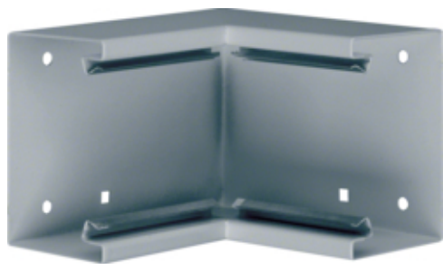
tehalit.BRS Kąt wewnętrzny 65x100, stalowy, ocynkowany