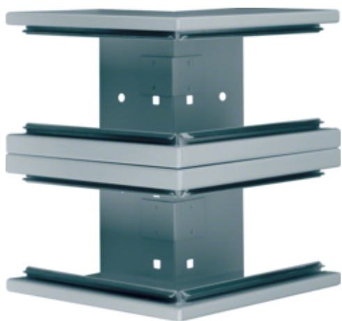
tehalit.BRS Kąt zewnętrzny 100x210 D stal ocynk