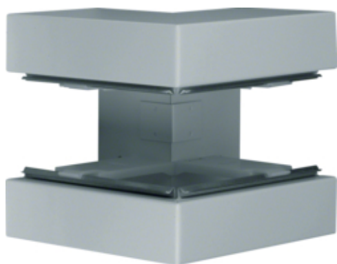
tehalit.BRS Kąt zewnętrzny 100x170 stal ocynk