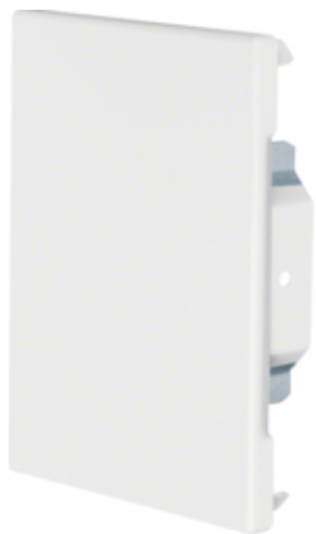
tehalit.BRS Końcówka 100x130 stal, ocynk