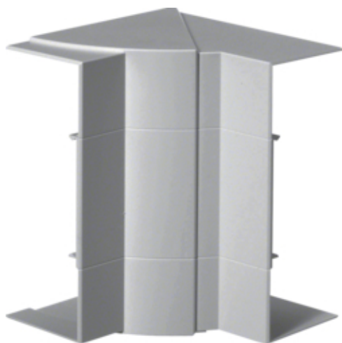
tehalit.BRP/BRAP Kąt wewnętrzny 65x170, lakier alu