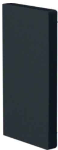
tehalit.BRP Końcówka 65x130, czarny