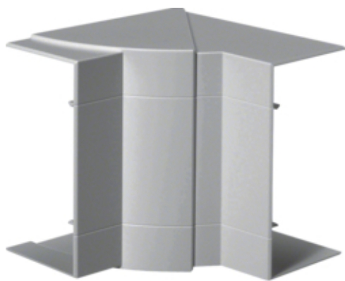
tehalit.BRP/BRAP Kąt wewnętrzny 65x130, lakier alu