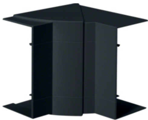
tehalit.BRP/BRAP Kąt wewnętrzny 65x130 czarny