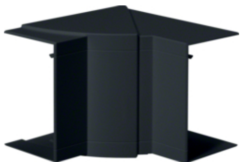
tehalit.BRP/BRAP Kąt wewnętrzny 65x100 czarny