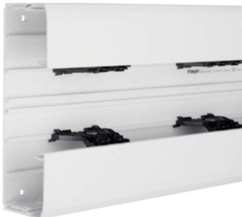
tehalit.BRN Podstawa 210mm, biały