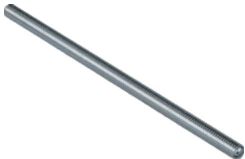
tehalit.BK Śruba M8x160 BK