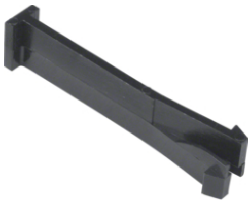
tehalit.BK Kotwa do BK Polamid stalowa