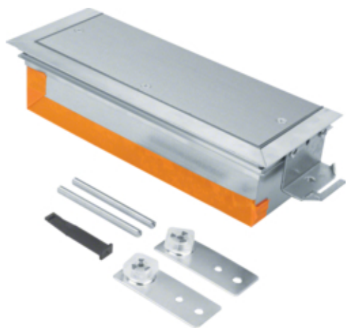
tehalit.BK Końcówka kanału wanna stalowa BKW 300x(70-110)mm stal