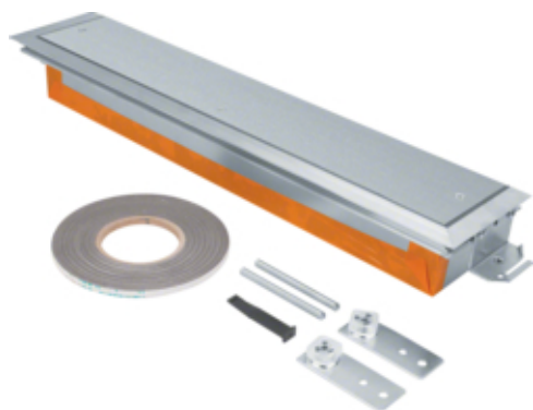
tehalit.BK Końcówka kanału wanna stalowa BKWD 600x(70-110)mm stal