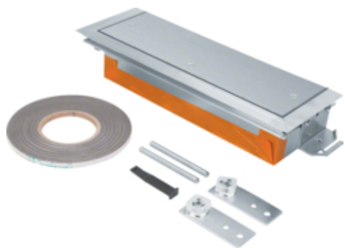
tehalit.BK Końcówka kanału wanna stalowa BKWD 300x(60-100)mm stal