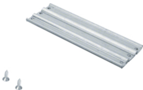
tehalit.BK Poprzeczka wzmacniająca N=200 stal