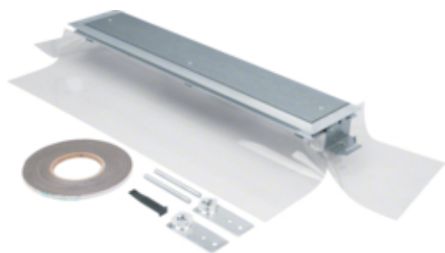
tehalit.BK Końcówka kanału boczna folia ochronna BKFD 600x(145-190)mm stal