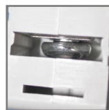
możliwość połączenia za pomocą szyn grzebieniowych