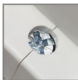
zacziski ze stali ocynkowanej