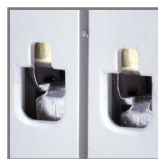
pojemność zacisków: 25mm 2