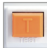
przycisk kontrolny TEST