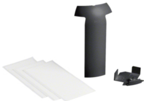
tehalit.SL Łącznik SL20115/EK40040 czarny