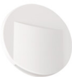
ERINUS LED O W