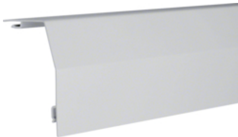
tehalit.RK 190 Pokrywa główna jasnoszary